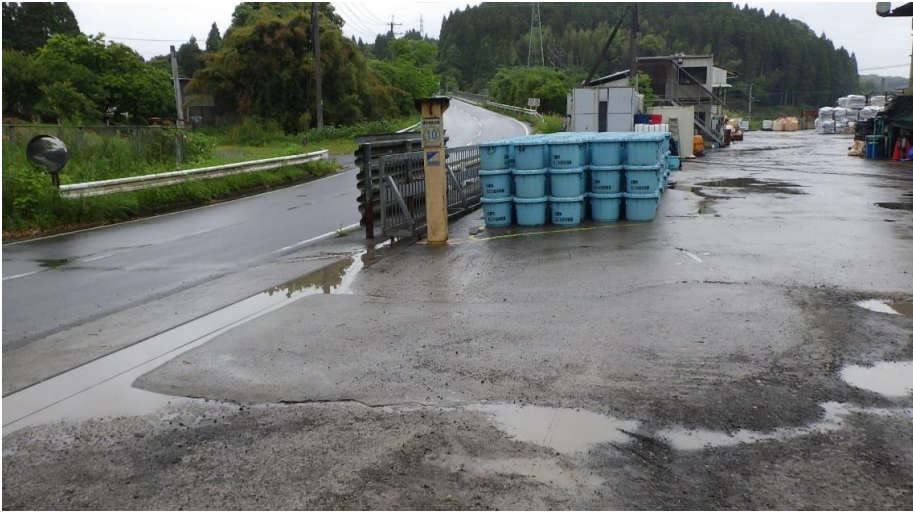
生ごみバケツ保管状況