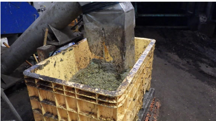
破碎された生ごみ